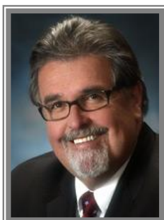
L'honorable Lawrence Cannon Ministre des Affaires étrangères Député fédéral du Pontiac Ministre responsable de l'Outaouais